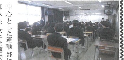
弓道部の部会の様子

迫る加入率となり見事にV字回復を果たした。この背景には部活動紹介での各部の工夫を凝らした映像を用いた勧誘や部活動体験での部の雰囲気良さ、先輩の人柄の良さが新入生に強く伝わったことが考えられるだろう。また、今回の集計の結果、運動部と文化部の学校全体での登録者の比率は約2:1となった。男女の内訳は、男子はサッカー、スポーツを